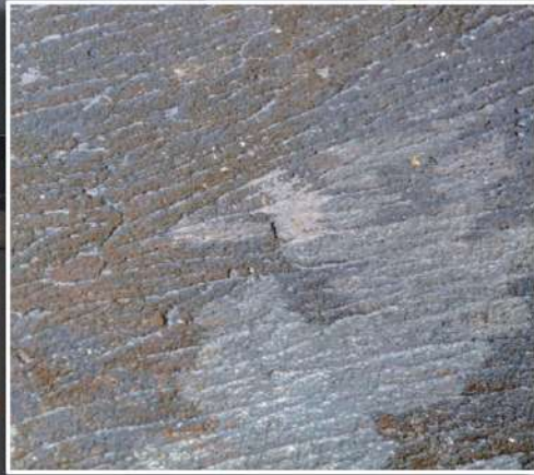
粗い滑り止めコーティング層